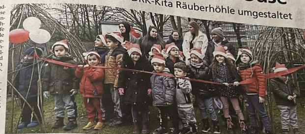
Die Kita-Kinder nutzen die beiden Weiden-Tipis bereits zum Spielen. Im Sommer werden sie grün.

Die hätten die umgestaltete Fläche bereits gut angenommen. „Die Kinder finden die Veränderung spannend und durften schon fleißig testen. Die Tipis stehen sehr fest. Sie sind noch gar nicht grün und trotzdem nutzen die Kinder sie schon gerne.“ Künftig gebe es im Kita-Garten einiges zu beobachten. „Die Fläche verändert sich über das Jahr. Pflanzen wachsen zur Klimaanpassung beitragen können.“